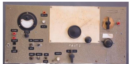
Boven : De zender van mijn opa, voor de opknopbeurt.